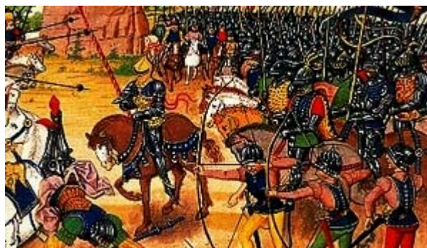
La bataille de Poitiers