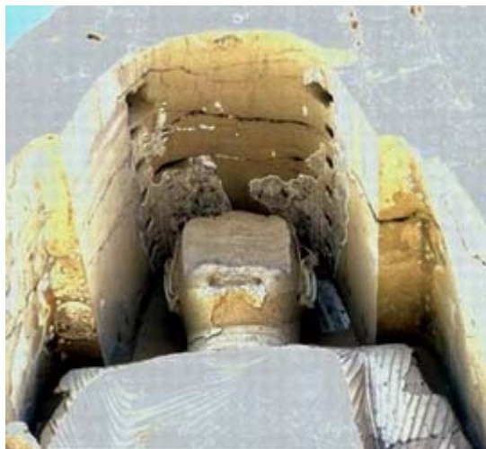
Bouddha géant d'Afghanistan, mutilé par les talibans

nullement agis en fous pervertissant le message de l'islam, mais bien au contraire en bons musulmans suivant à la lettre les prescriptions de leur religion.