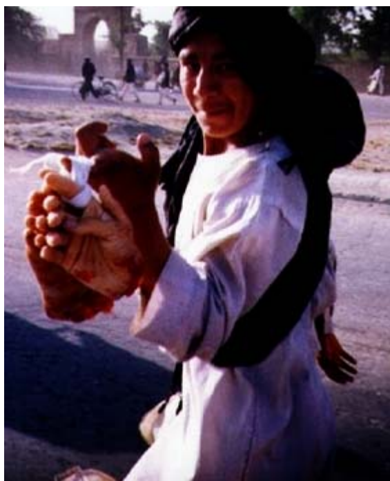
Jeune garçon musulman, exhibant un « chapelet » de mains coupées à des voleurs.

Cette règle du Coran est connue, et appliquée bien entendu en terre d'islam : « Le voleur et la voleuse, à tous deux coupez la main, en punition de ce qu'ils se sont acquis, et comme châtiment de la part d'Allah. Allah est puissant et sage. » (sourate 5, verset 38).