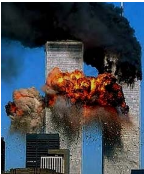
Les attentats du 11 septembre 2001

Il n'est qu'à voir également, passées ces premières réactions spontanées, l'absence de condamnation formelle de ces attentats meurtriers par la majorité des musulmans, et même les tentatives d'excuses et de justification de ces actes barbares au nom d'une prétendue culpabilité des Etats-Unis, voire de l'Occident tout entier.