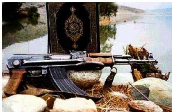
La guerre sainte, ou l'usage des armes commandé par le Coran, et revêtu de l'immense légitimité de son origine divine.

C'est une obligation pour les musulmans que cette Guerre Sainte. Même ceux à qui cela ne plaît pas doivent la mener, sans quoi ils désobéiraient à Allah :