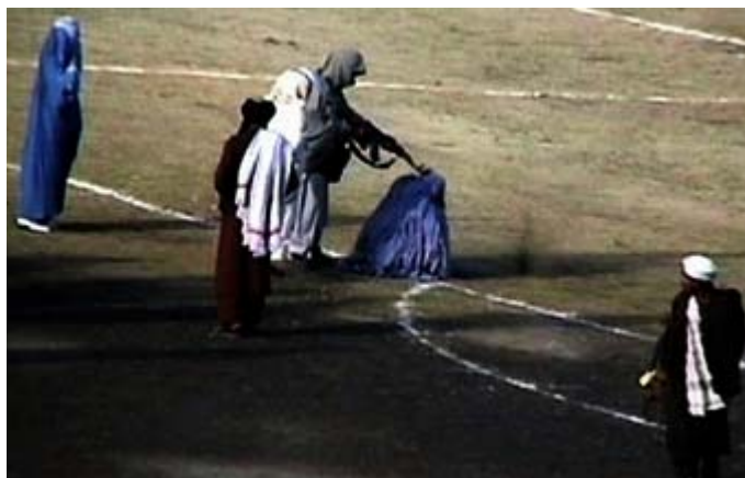
Exécution d'une femme adultère en Afghanistan.

« Il n'est pas licite de répandre le sang d'un musulman, sauf dans l'un de ces trois cas : une personne mariée qui commet l'adultère, une vie humaine pour une vie humaine, et celui qui abandonne sa religion en se séparant de la Oumma [Communauté des croyants] ». (rapporté par Bukhari et Muslim).