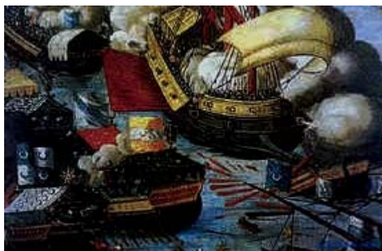
La bataille de Lépante, en 1571

également la cathédrale Saint-Pierre en mosquée. Les Turcs possédaient depuis longtemps une très importante flotte qui sillonnait la Méditerranée, et grâce à laquelle ils pillaient régulièrement les côtes d'Italie, y enlevant par milliers des Chrétiens, ramenés enchaînés en terre d'islam, pour y servir comme esclaves 1 . La grande victoire chrétienne de Lépante a totalement défait cette flotte turque, qui ne s'est jamais totalement reconstituée, mettant ainsi fin (ou du moins en ralentissant la fréquence et l'ampleur) à ces pillages et enlèvements, sécurisant davantage la Méditerranée, mais surtout, bien sur, sauvant Rome et la Chrétienté d'Occident de subir le même sort que Constantinople et la Chrétienté d'Orient.