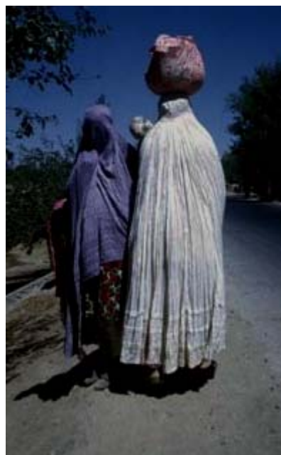
Tenue de la femme musulmane : selon la tendance libérale (à gauche), et selon la tendance non libérale (à droite).

Il existe encore toute une série de prescriptions, d'ordre vestimentaire ou esthétique, faites aux femmes par la Charia (loi musulmane), parmi lesquelles, par exemple, l'interdiction de se faire faire des tatouages, d'avoir recours à la chirurgie esthétique, de s'épiler les sourcils, ou encore de porter une perruque.