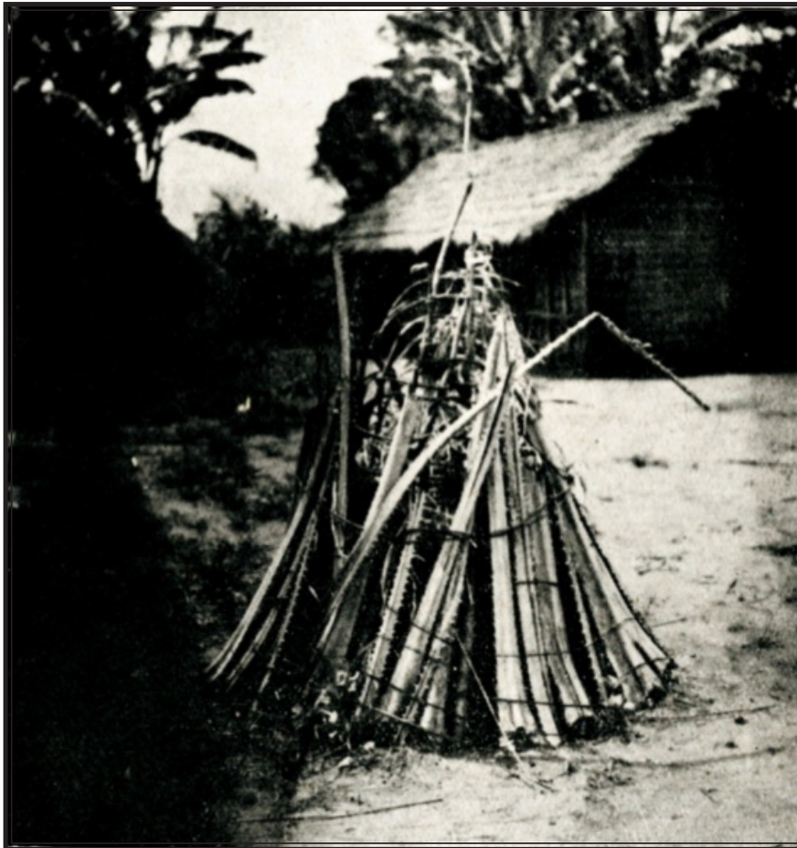
MOYEN-CONGO : BRAZAVILLE.