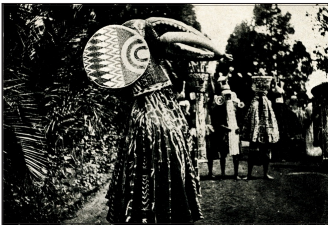
CAMEROUN. — Danseuses à Fomban.

secrètes qui cachent leurs exactions et leurs crimes sous des prétextes plus ou moins rituels. Que de crimes inutiles et de spectacles horribles sans autre préoccupation que celle de frapper l'esprit des Noirs pour mieux les rendre esclaves! E. Cailliet rapporte une longue description du R. P. Dove en mission dans l'île Macathy, sur la côte de Gambie. Un chef puissant de Wooley envoya chercher un féticheur pour faire fétiche afin d'éloigner la guerre de son fief. Moyennant dix esclaves et cinq chevaux, le sorcier commença son travail : « ... Deux trous furent creusés dans la terre près du fort Kimmington, ayant deux pieds de profondeur ... Puis on fit choix d'une jeune fille de douze à treize ans..., on fixa ses pieds dans les trous, malgré les lamentations de la mère et les cris déchirants de la victime ; et tandis que quelques hommes apportaient de la terre glaise, d'autres étaient occupés à emmurer, jusqu'au-dessus de la tête, le corps de la jeune fille, qui fut enterrée vivante. »