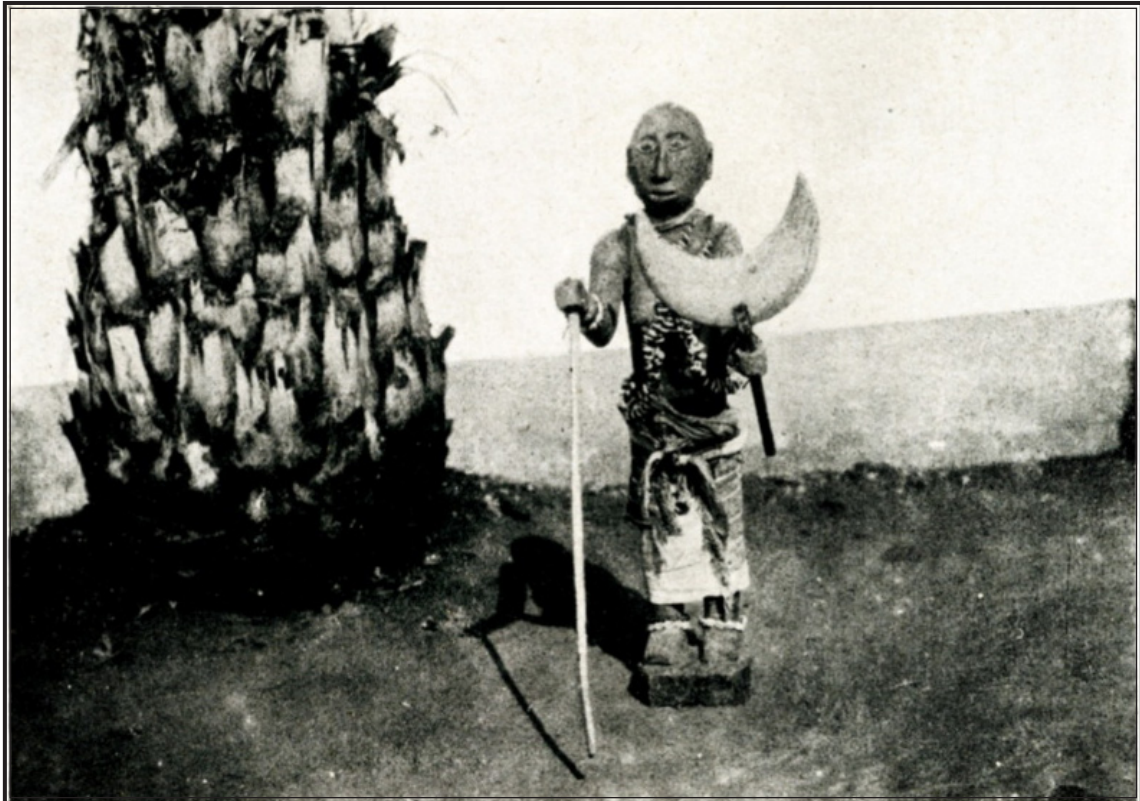
DAHOMÉY. — Fétiche de Mahou (dieu) au palais d'Abbomey.