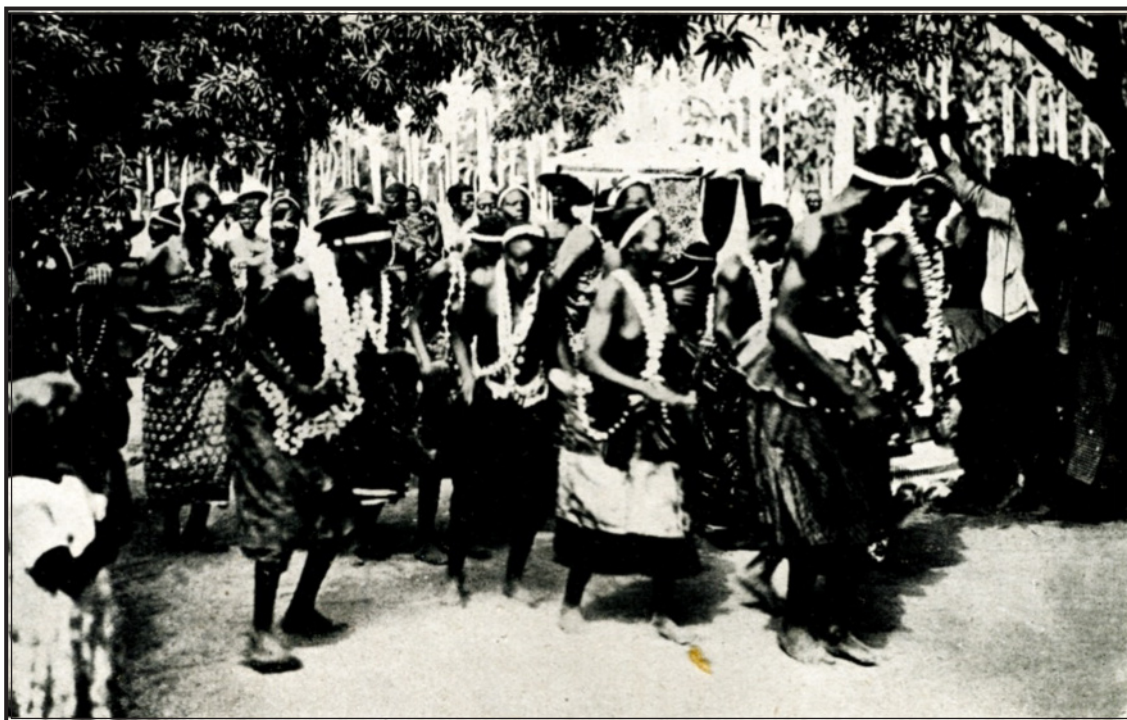
DAHOMÉY. — Danses de féticheurs et de féticheuses.