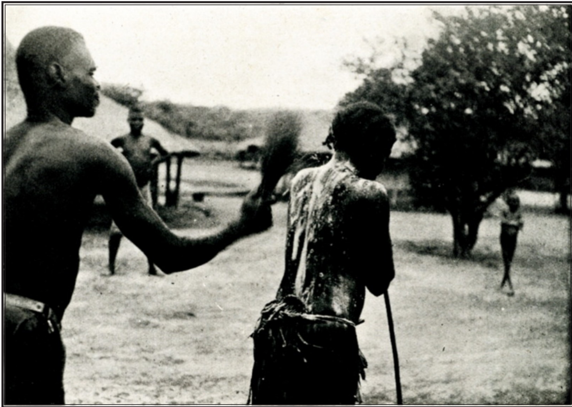
OUBANGHI-CHARI : DOMÉTÉ.

Nous avons appris alors que, pour accroître leur force, leur souplesse ou d'autres facultés, les féticheurs noirs contractaient une alliance, le plus souvent « spirituelle » et non sanguine, avec une bête ; panthère pour foudroyer rapidement leurs ennemis : lion pour dominer leurs semblables ; hyène pour voir la nuit, etc... Généralement, le féticheur ordonne de capturer des petits du fauve, contracte l'alliance par l'échange de sang (cette fois suivant un rite magique) et relâche le bébé dans la forêt. Beaucoup de féticheurs reculent devant cette pratique magique, car si le fauve est blessé ou tué, le « frère humain » est aussi tué ou blessé. Il n'y a que la mort par vieillesse qui n'atteint pas son double » ; elle se contente de lui retirer la qualité acquise par l'échange de sang. Par la suite, et dans les autres coins de l'Afrique, je devais entendre des histoires d'alliances qui ne nécessitaient pas obligatoirement l'échange de sang, mais simplement l'apport à l'être humain d'une partie de la « garde-robe » (poils par exemple) de la bête. En d'autres cas, les plus nombreux, il suffit que le féticheur « transmette sa volonté » à l'animal pour que l'alliance soit réalisée.