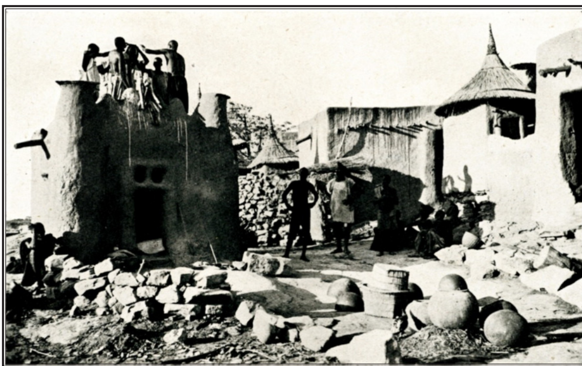
SOUDAN FRANÇAIS : SANGHA. Cérémonie rituelle sur une case de « fétiche ».