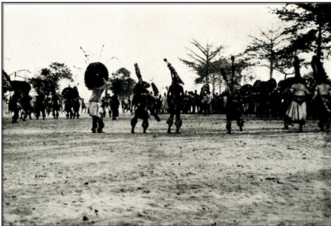
GUINÉE. — Danseurs à Youkounkoum Coniagais

fort souvent, le contre-féticheur se trouvait mal, tellement il devait lutter contre l'influence des féticheurs cherchant à combattre sa puissance ; il maigrissait presque à vue d'œil et, après deux semaines, il tomba malade. Les « hommes de la nuit recommencèrent leurs raids nocturnes. Le contre-féticheur se décida à appeler du renfort magique en la personne d'un de ses collègues et bientôt deux autres voleurs tombèrent sous les flèches des volés. On ne sait combien de temps aurait duré cette passionnante suite de chocs psychiques si le féticheur des « hommes de la nuit », craignant pour son prestige dans son clan, n'avait pas fait faire des avances au contre-féticheur. Moyennant que l'on ne féticherait plus contre les hommes de la secte secrète, il s'engageait à ne plus diriger les voleurs vers le groupe de villages protégé par le contre-féticheur.