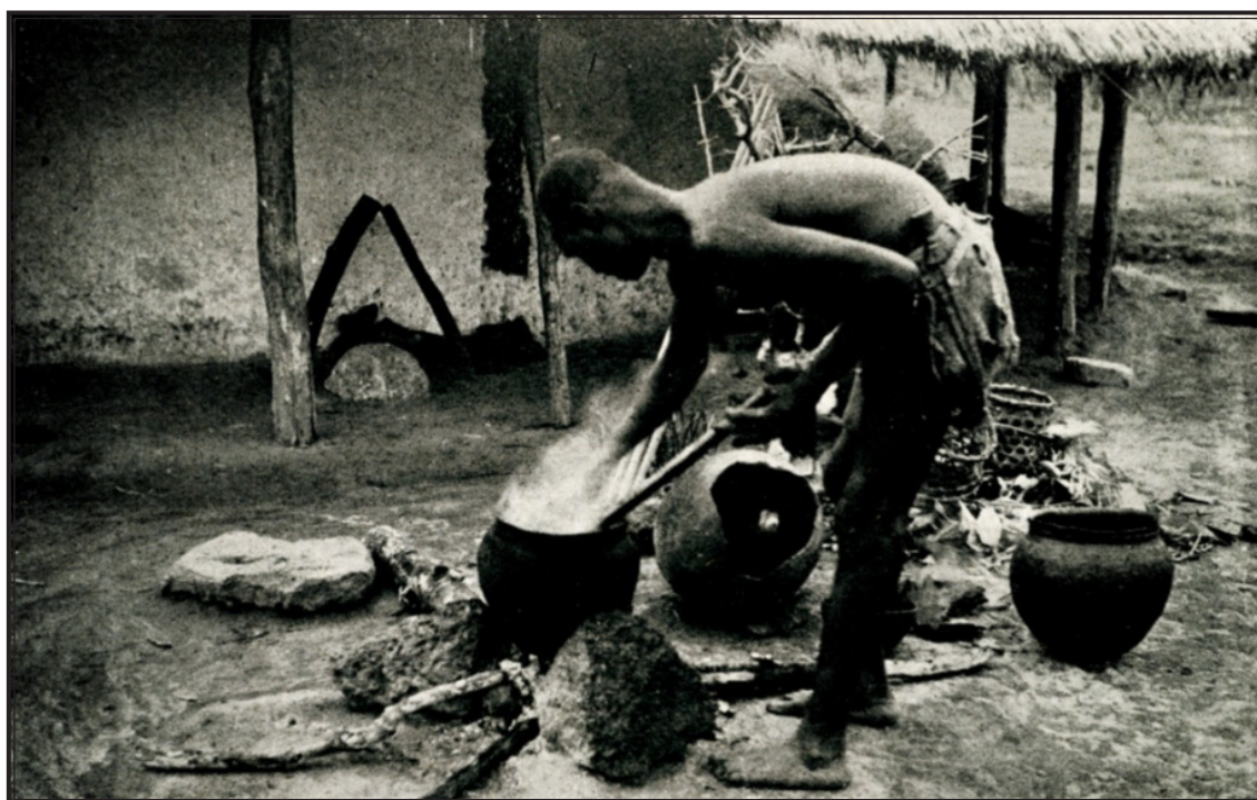
OUBANGHI-CHARI : DOMÉTÉ (à 60 km de Banghi). Féticheur préparant une macération de plante dans de l'eau chaude dont il se servira pour asperger une malade.

successives et non massives. C'est ainsi que, dans son sommeil, il arrive à connaître la maladie que les esprits lui révèlent ». Des tribus indiennes vénèrent le peyotl, plante métagénomigène utilisée par les magiciens ; » une heure ou deux après l'ingestion de peyotl, on assiste à une série de visions kaléidoscopiques et de scènes les plus merveilleuses et les plus complexes ; l'ivresse visuelle se complique parfois d'étranges interventions sensorielles qui déconcertent. » Arrêtons là cette énumération schématique de plantes aux vertus magiques que connaissent certainement les féticheurs noirs qui en gardent jalousement le secret. Le mystère qui entoure la magie des Noirs n'a pas encore permis aux Blancs de connaître les plantes africaines qui aident à l'état de transe des sorciers. Pourtant M. Landrin, dans sa thèse De l'iboga à l'ibogaïne , décrit comment, en Afrique, « le yohimbe (26) et l'iboga absorbés à l'état naturel ou en infusion, déterminent une folie épileptique avec paroles à sens prophétique » (27) .