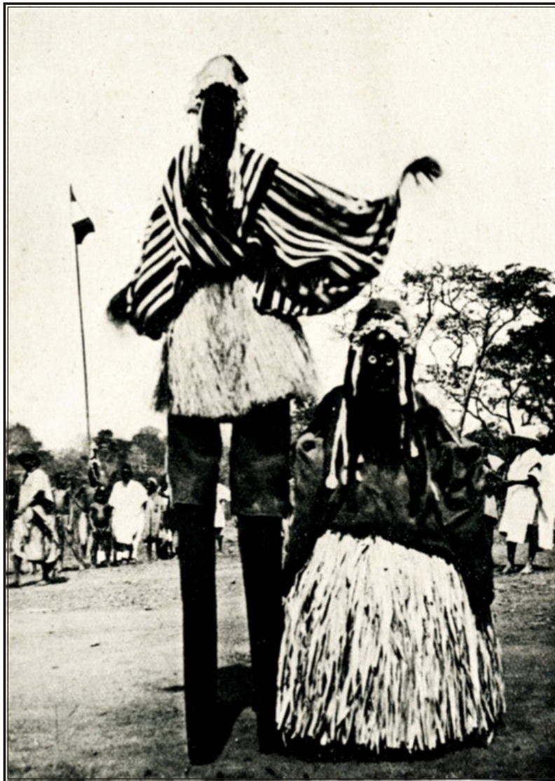
GUINÉE : KOUSAMKORO. Danseuses Guersés. Un gnamonkogo.

Les instructions étaient formelles, le vieux chef devait ressusciter. Les cinq sorciers s'attelèrent à la tâche ; ils recommencèrent leur boucherie humaine sur trois autres proches parents du potentat et le cadavre immobile sur une natte, à la vue de l'assemblée, frissonna, puis se redressa. Le Nagos était revenu à la vie et vécut encore quelques années sans être paralysé, avant de passer brusquement de vie à trépas sans avoir eu le temps d'alerter ses féticheurs.