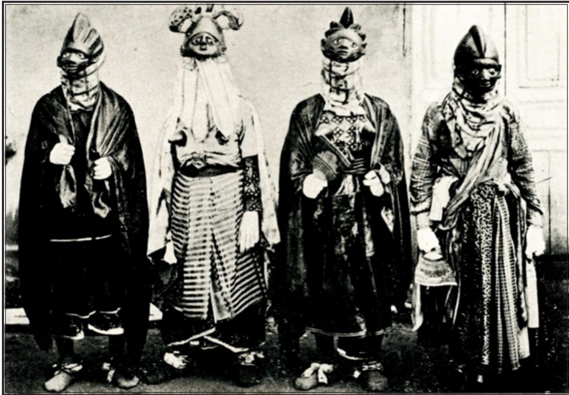
DAHOMÉY. — Féticheurs.

L'Iroumé est, en réalité, une association de magiciens, guérisseurs et sorciers, qui se recrutent parmi les familles influentes et riches de la région. Ses rites rappellent ceux en usage dans la plupart des sociétés dites secrètes ; ils se déroulent surtout pendant la saison sèche qui est aussi l'époque choisie pour initier les nouveaux membres. Aux yeux des gens de l'Iroumé, les hommes peuvent se classer en trois catégories les étrangers à la confrérie, les futurs initiés et les initiés.