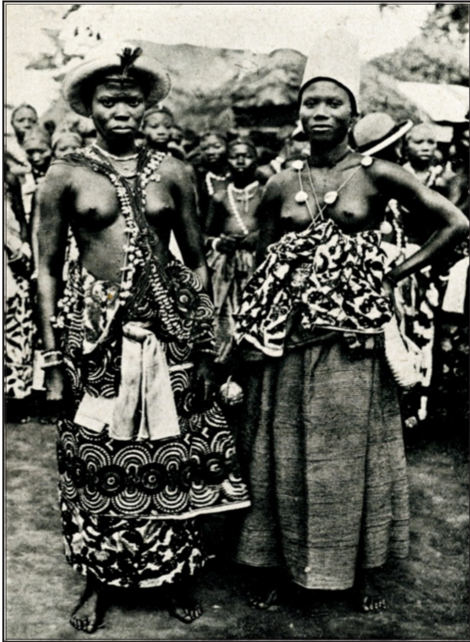
DAHOMÉY. — Féticheuses à Quidah.

d'humains — des bûchers, une assistance souvent peinte d'arabesques qui sont des signes mystérieux, un tam-tam lancinant, des contorsions rituelles, tels sont les accessoires essentiels de la plupart des féticheurs, sorciers ou magistes.