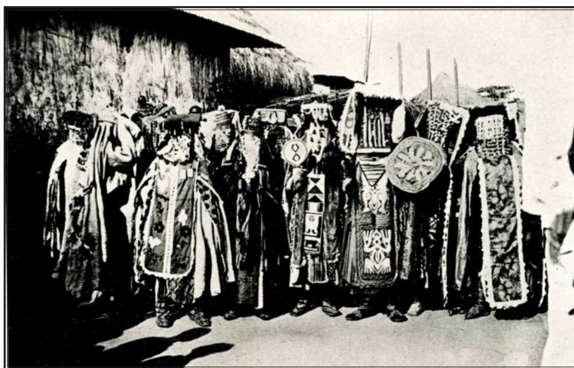
DAHOMÉY : HOUTITOS. — Fantômes revenants.

vain l'évoque magistralement : « Imaginez, sous une nappe de lumière dure et nacrée, deux cents squelettes en train de gigoter, deux cents squelettes noirs sous la lune froide, des squelettes saisis comme un négatif. C'était cela, horriblement : deux cents malades, mâles ou femelles, n'ayant plus que la peau et les os, deux cents sommeilleux enfiévrés, mais les yeux vagues, le souffle bref, tirés du coma et impérieusement animés, soutenus par le tam-tam, qui s'affrontaient en gémissant, qui offraient tour à tour, aux rayons de la lune, leurs genoux pointus, leur dos cassé, leur ventre creux, en des figures de danses lubriques... Ils ne voulaient pas dormir, pas mourir, ces spectres. Ils voulaient danser, vivre, oublier, faire l'amour encore une fois. Leurs bouches édentées voulaient chanter, mais elles manquaient de chanson, elles grimaçaient en silence. Ils titubaient, s'affaissaient dans la poussière. La mort les faisait frissonner par terre, en tas, mais le tam-tam les relevait, remettait debout par miracle leurs paquets d'os forcenés... Quelques-uns ne se relevèrent pas. Sans doute avaient-ils dansé leur dernier tam-tam... »