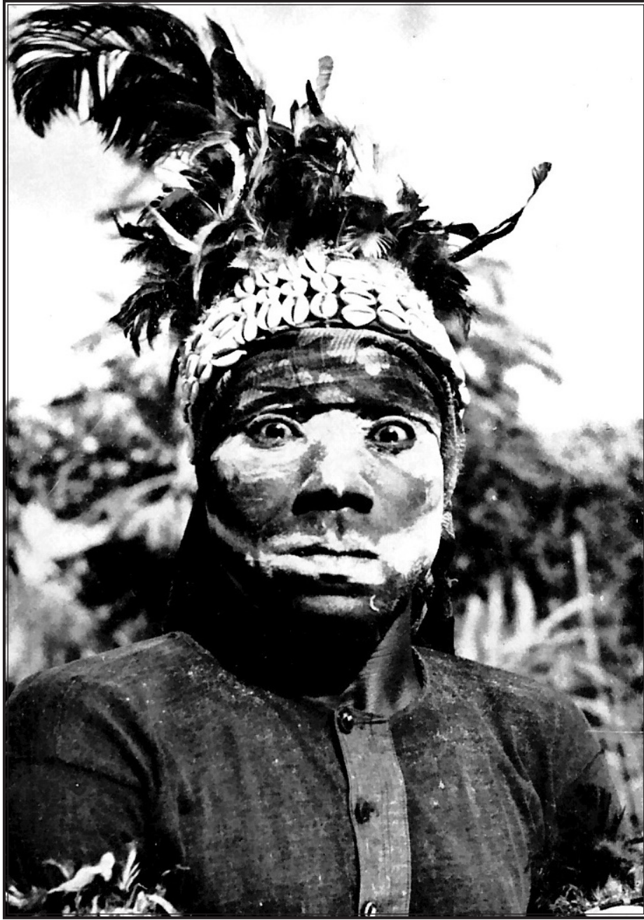
MOYEN-CONGO : Brazaville. Féticheur Baongo.