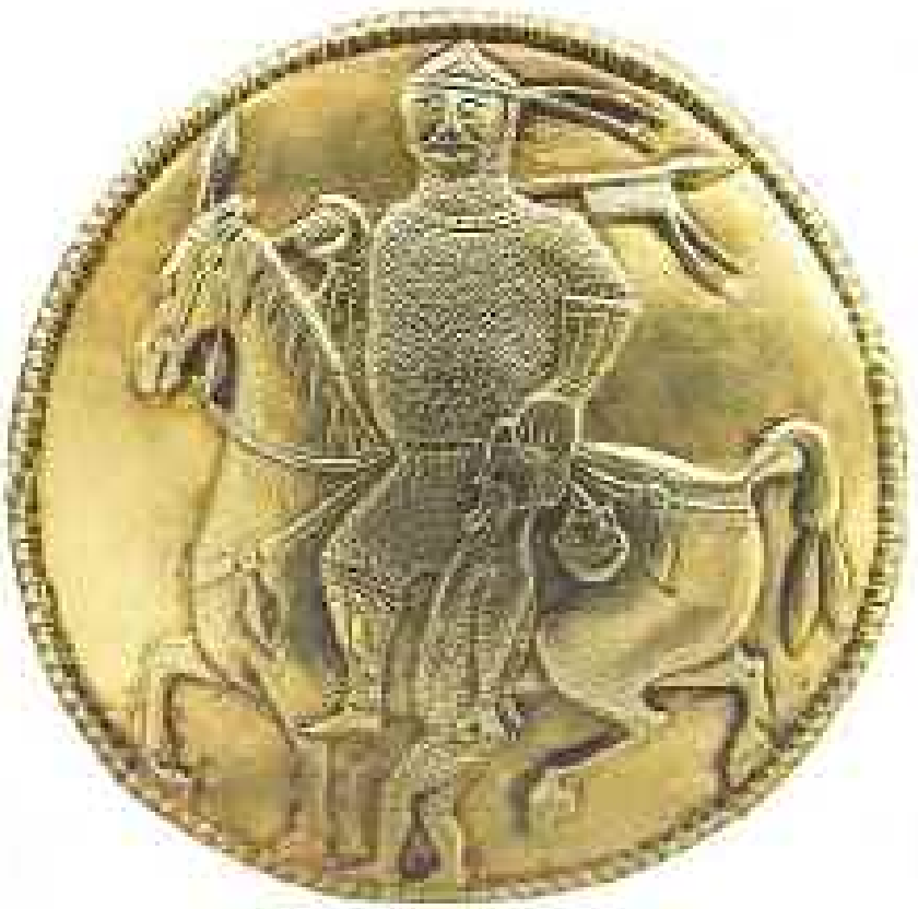
« Prince victorieux » ramenant un prisonnier. Une tête coupée pend au pommeau de la selle.

Ornement d'un vase d'or provenant du « trésor de Nagyszentmiklos » (IXe – Xe siècle). Exemple des arts qui ont pu être pratiqués dans l'Empire khazar. (voir chapitre premier) Kunsthistorisches museum, Vienne.