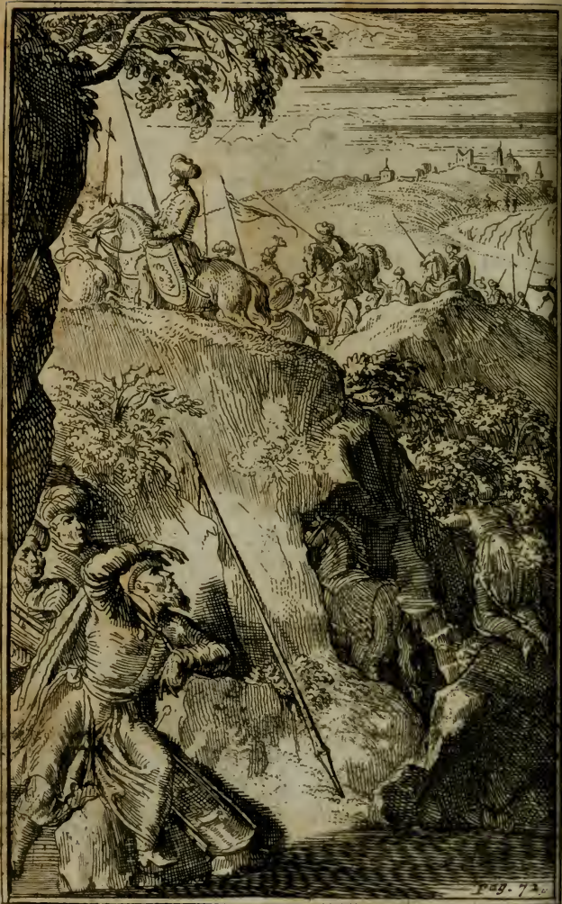
Fuite de Mahomet de la Mecque a Medine