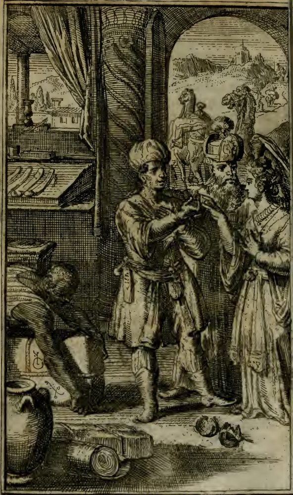
Mahomet marchand, Epousant Cadiga