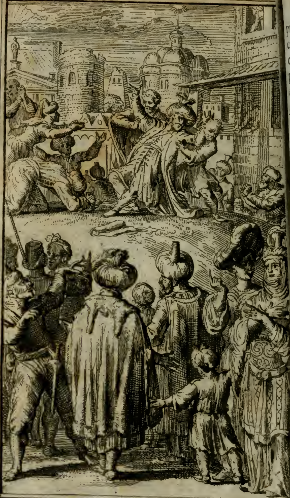
Mahomet prophetizant en extase.