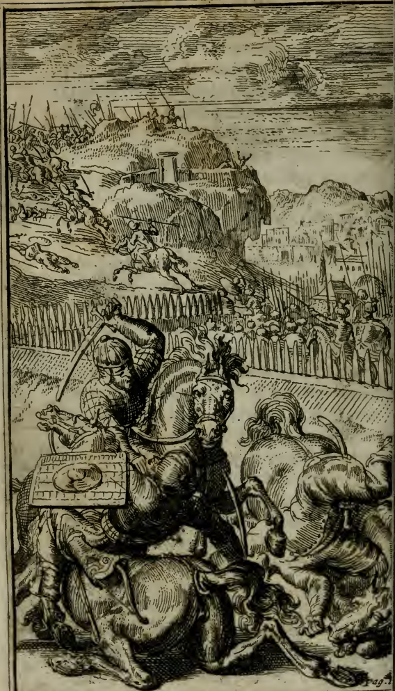
Mahomet Triomphant de ses Voisins