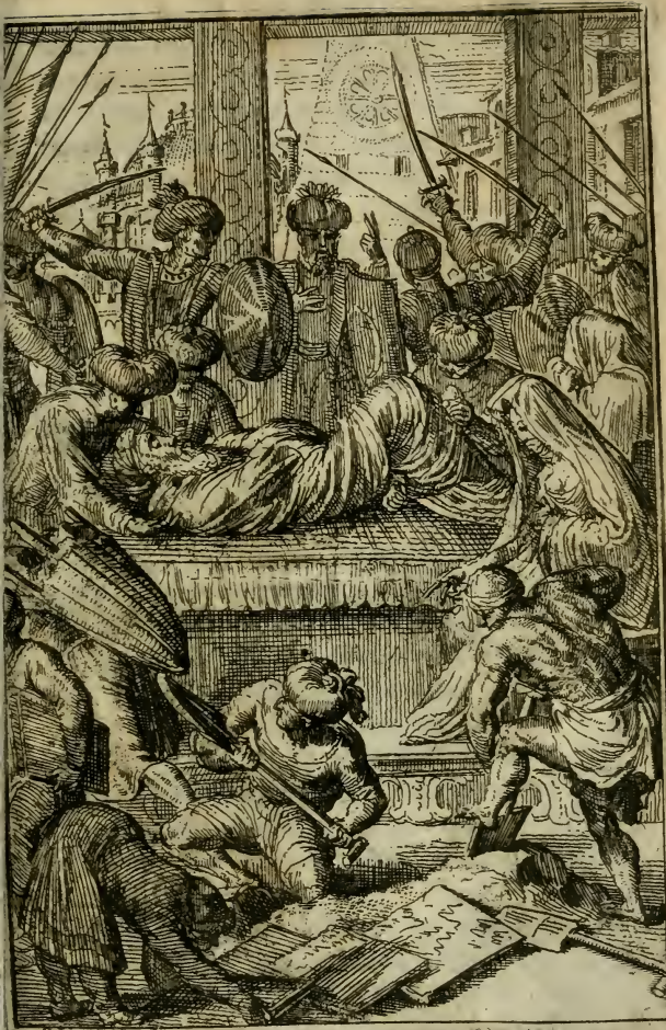
Mahomet Mort et Enterreé.