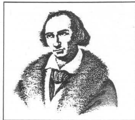
Georg Friedrich Daumer.

Le néo-romantisme est quête d'identité. Il est aussi transgression . Demain, toute pensée valable se rangera sous le signe de la "transgression", d'une transgression très diversifiée dans ses stratégies mais qui jettera un soupçon, un soupçon véritablement "tueur", sur les conformismes d'hier et d'aujourd'hui. Mais le XIX ème siècle a connu une figure qui, en son temps déjà, était inclassable parce qu'elle "transgressait" trop: Georg Friedrich DAUMER (1800-1875). En 1985, cent ans après sa mort, repenser de ce personnage controversé, c'est manifester une volonté de transgresser nos discours creux qui sont la honte de ces dernières décennies. Nous verrons pourquoi, en mesurant l'ampleur des débats dans ce XIX ème non positiviste, juxtaposé à côté d'un XIX ème générateur des platitudes que nous connaissons.