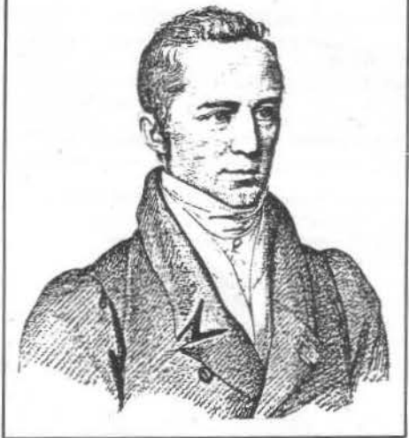
Carl Gustav Carus (1789-1869) a jeté les bases philosophiques du panthéisme romantique qui revalorisait le monde vivant, négligé par les systèmes conceptuels classiques.

Le retour aux origines vitales ne confisque nullement au "moi", au noyau identitaire individuel ou collectif sa spécificité.